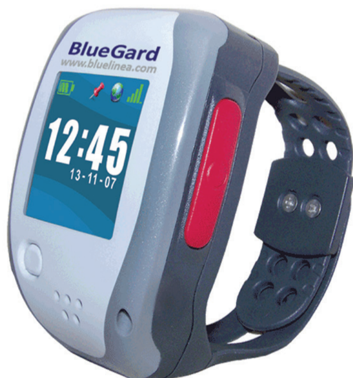
BlueGard® / Favoriser l'autonomie des personnes désorientées.

Disponible pour les particuliers comme pour les établissements de santé, BlueGard® est une solution fiable et rapide à mettre en place pour protéger les personnes Alzheimer et leur permettre de retrouver une certaine autonomie.